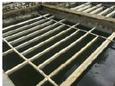
Foto 52. Módulos de Floculación PTAP