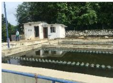
Foto 51. Módulos de Filtración PTAP

El sistema de tratamiento del municipio de Luruaco está conformado por una Planta de Tratamiento de Agua Potable (PTAP) de tipo convencional, con una capacidad de 100 L/Seg, ubicada sobre la margen derecha de la vía de la Cordialidad que conduce del Municipio de Luruaco a la ciudad de Cartagena, sobre una cota elevada, lo que permite desde aquí realizar la distribución por gravedad del agua tratada hacia la cabecera del Municipio. Dentro del sistema de tratamiento se realizan los procesos de floculación, sedimentación, filtración y finalmente la desinfección, para lograr los parámetros necesarios de calidad del agua