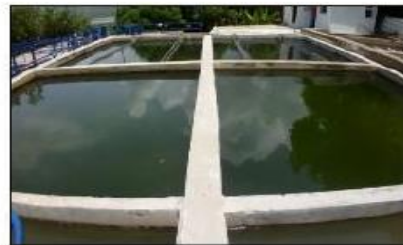
Foto 54. Módulos de Sedimentación PTAF