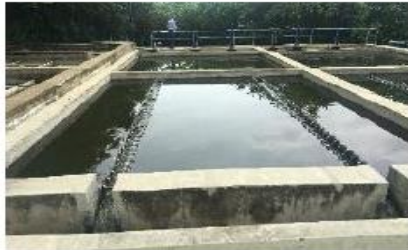
Foto 53. Módulos de Filtración PTAP

“POR MEDIO DE LA CUAL OTORGA UNA CONCESION DE AGUAS SUPERFICIALES A LA SOCIEDAD DENOMINADA AGUAS DEL SUR DEL ATLÁNTICO S.A. E.S.P., PARA ABASTECER EL ACUEDUCTO DEL MUNICIPIO DE LURUACO Y LOS CORREGIMIENTOS DE ARROYO DE PIEDRA, SANTA CRUZ, PALMAR DE CANDELARIA, LOS PENDALES, LOS LÍMITES Y LA PUNTICA”